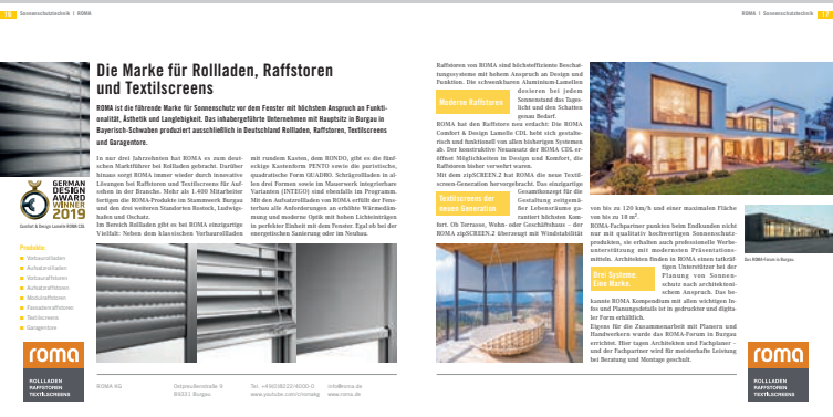
Beispiel für 2 Seiten Unternehmensporträt