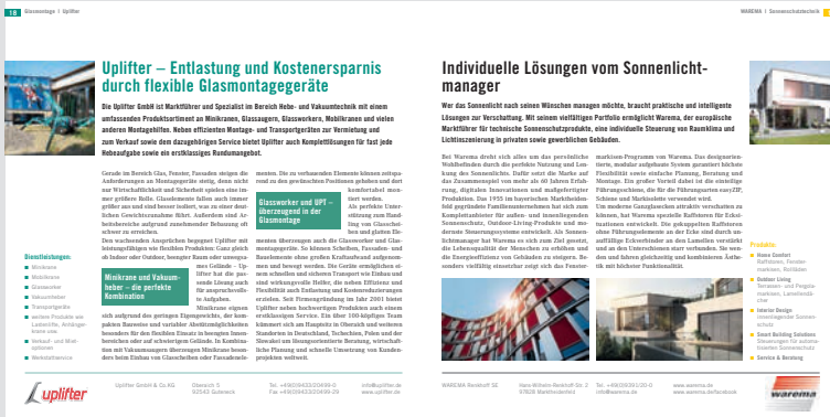
Zwei Beispiele für jeweils 1 Seite Unternehmensporträt